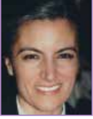
Hatice Tuba Sanal Sağlık Bilimleri Üniversitesi, Gülhane Tıp Fakültesi, Radyoloji Anabilim Dalı, Ankara